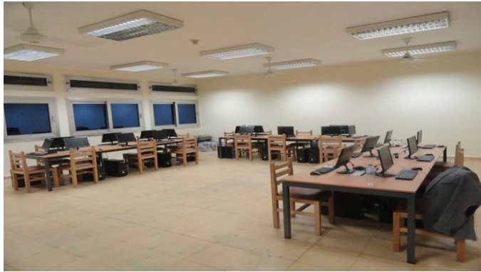
تجهيزات وحدة تكنولوجيا المعلومات