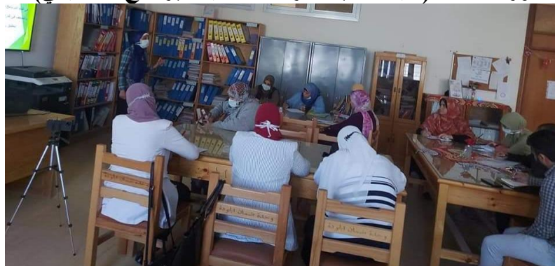
ورشة عمل (فنيات كتابة الدراسة الذاتية للبرنامج الأكاديمي)