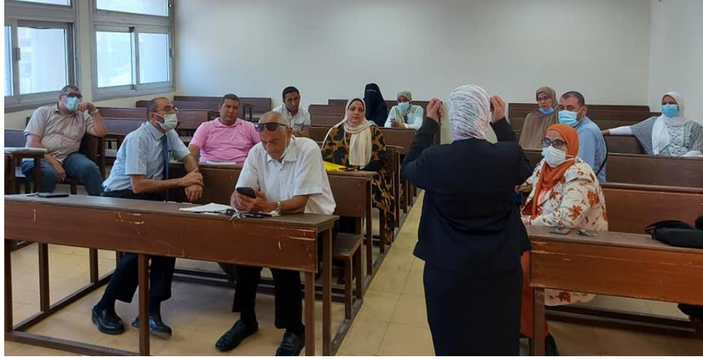
صور من الدورات التدريبية للسادة أعضاء هيئة التدريس والهيئة المعاونة للتعريف بنظام الساعات المعتمدة والإرشاد الأكاديمي