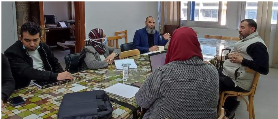
زيارة المتابعة لبرنامج الكيمياء والكيمياء التطبيقية