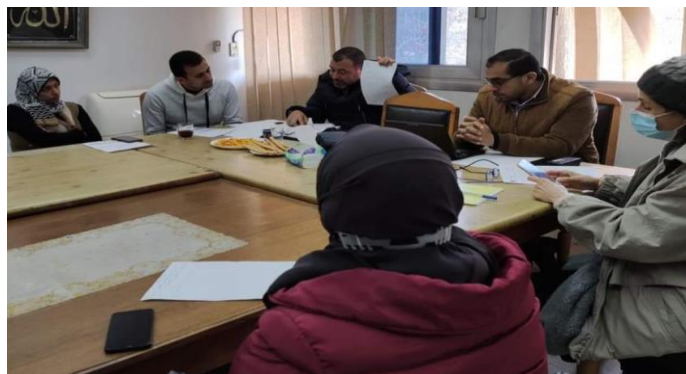
زيارة المتابعة لقسم النبات، أيام الأربعاء ٩/٣/٢٠٢٢ والإثنين ١٤/٣/٢٠٢٢ والأربعاء ١٦/٣/٢٠٢٢