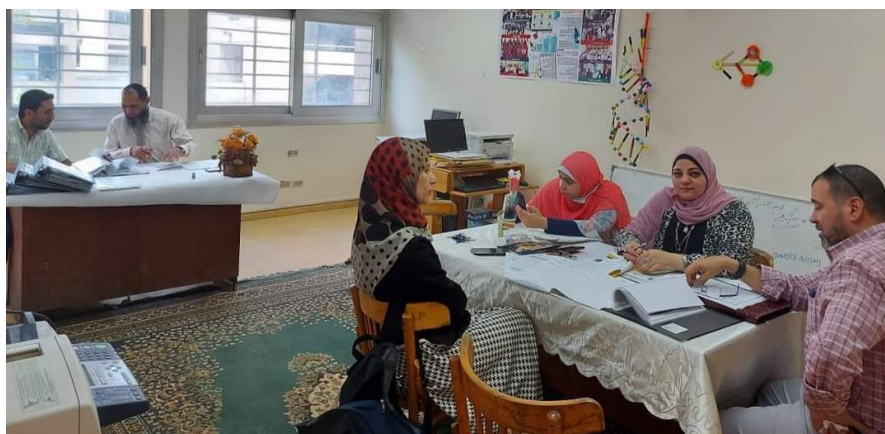
زيارة المتابعة لبرنامج البيوتكنولوجي