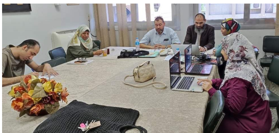
زيارة المتابعة لقسم الفيزياء