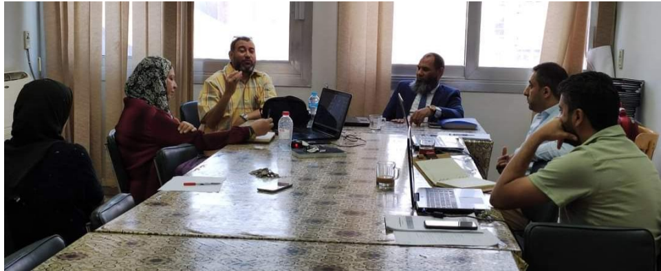
زيارة المتابعة لقسم الجيولوجيا