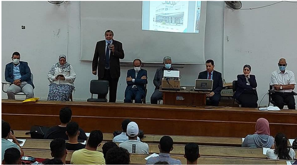
صورة من اللقاء التعريفي للطلبة وأولياء الأمور عن اللانحة الجديدة ونظام الساعات المعتمدة والإرشاد الأكاديمي