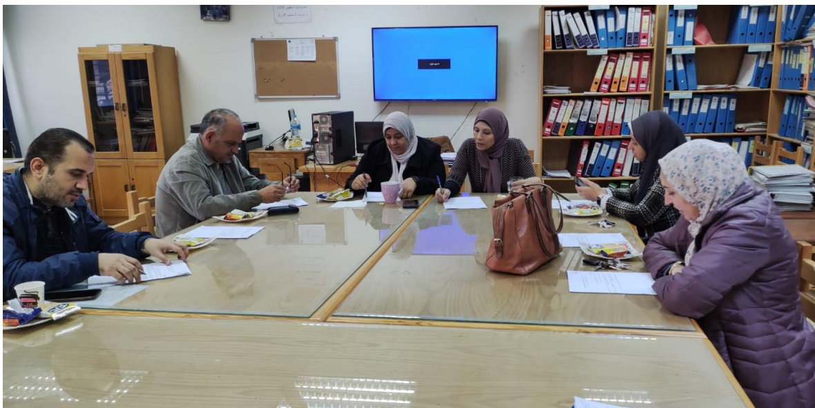
اجتماع يوم الأربعاء الموافق 2023/12/20