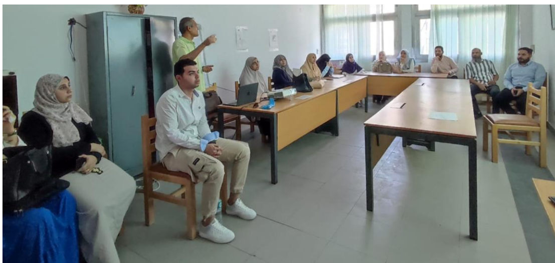
توصيف البرامج والمقررات لكليات ومعاهد التعليم العالي