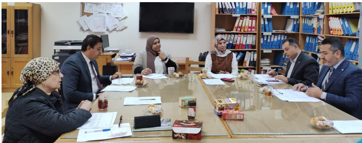
اجتماع لجنة المراجعة الداخلية بوحدة ضمان الجودة لمناقشة صياغة رؤية ورسالة والأهداف الإستراتيجية للكلية (2025-2021)