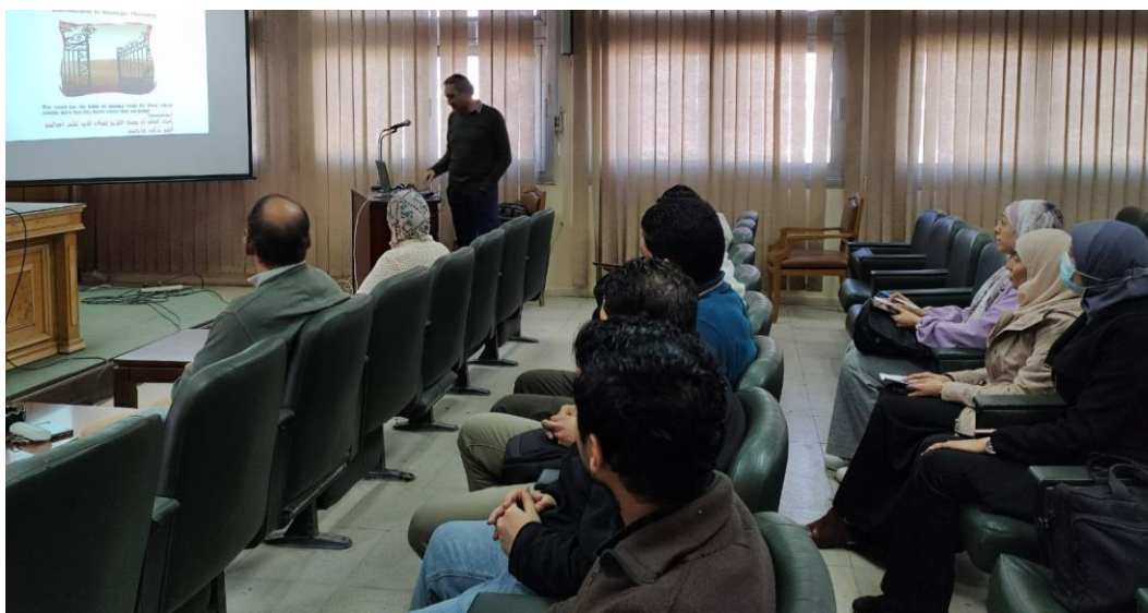
التخطيط الاستراتيجي لكليات ومعاهد التعليم العالي