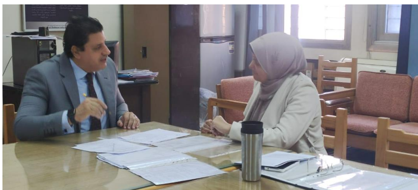
اجتماعات لجنة الدعم الفني مع فريق جودة برنامج البيوتكنولوجي