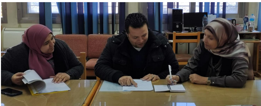
اجتماعات الوحدة مع لجنة النشر والإعلام بالوحدة (لنشر أنشطة الوحدة على المنصات الإلكترونية الرسمية للكلية)