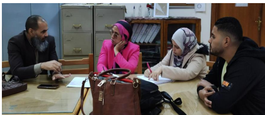
اجتماعات لجنة الدعم الفني مع فرق جودة برامج قسم الجيولوجيا