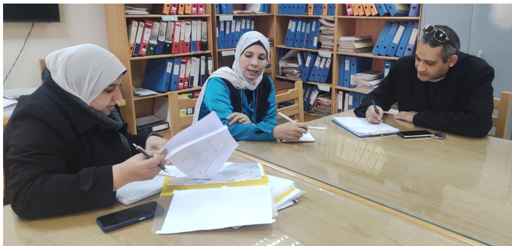
اجتماعات الوحدة مع لجنة التدريب بالوحدة (لوضع الخطة الزمنية للدورات التدريبية)