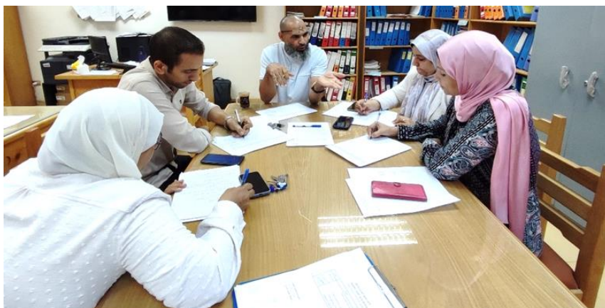
اجتماع لجنة الدعم الفني مع فريق جودة برنامج الكيمياء التطبيقية