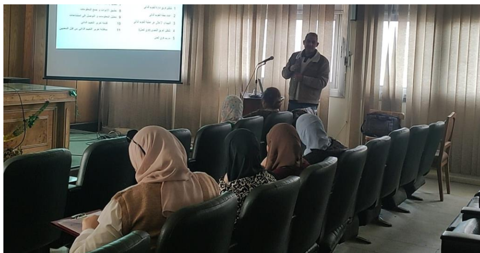
التقويم الذاتي لكليات ومعاهد التعليم العالي 2024