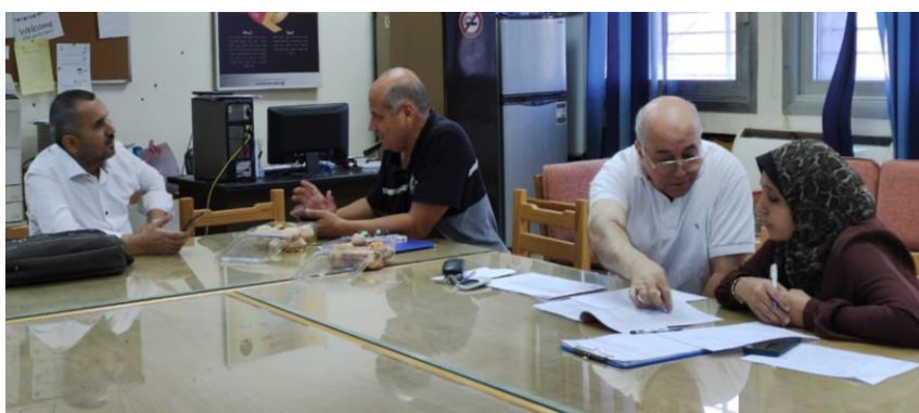
اجتماعات لجنة الدعم الفني مع فرق جودة برامج قسم الكيمياء