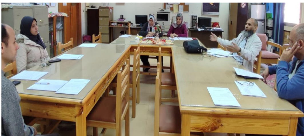
اجتماع يوم الإثنين الموافق 2024/3/25