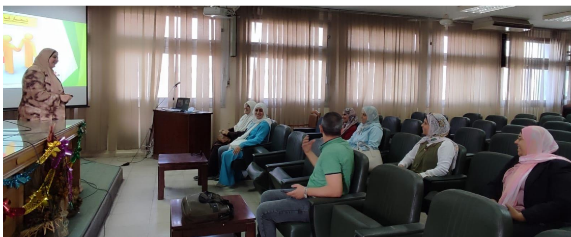
الإرشاد الأكاديمي ونظام الساعات المعتمدة