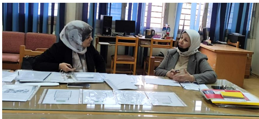
مراجعة المعيار السابع (ضمان الجودة وتقويم البرنامج)