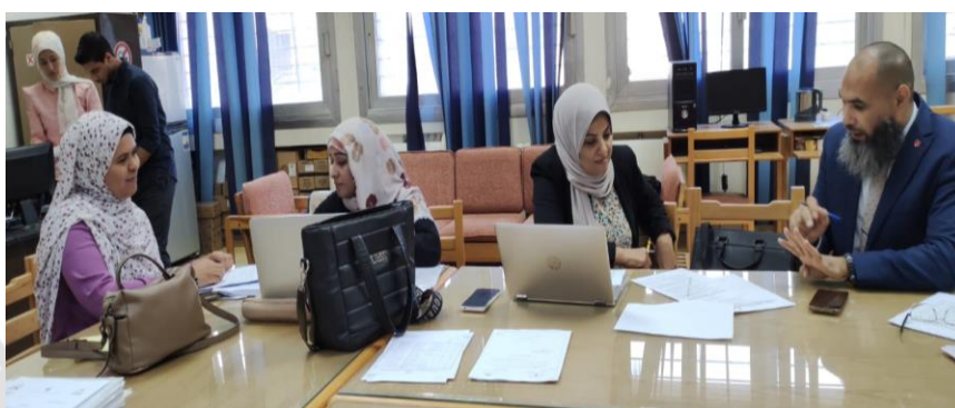
اجتماعات لجنة الدعم الفني مع فرق جودة برامج قسمي الرياضيات والجيولوجيا