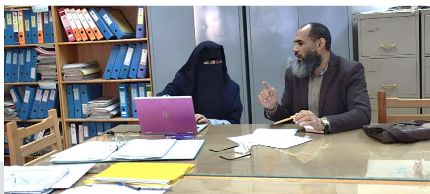
مراجعة المعيار الثالث (التعليم والتعلم)