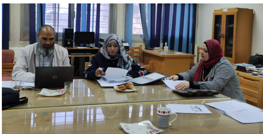
مراجعة المعيار الثاني (تصميم البرنامج)