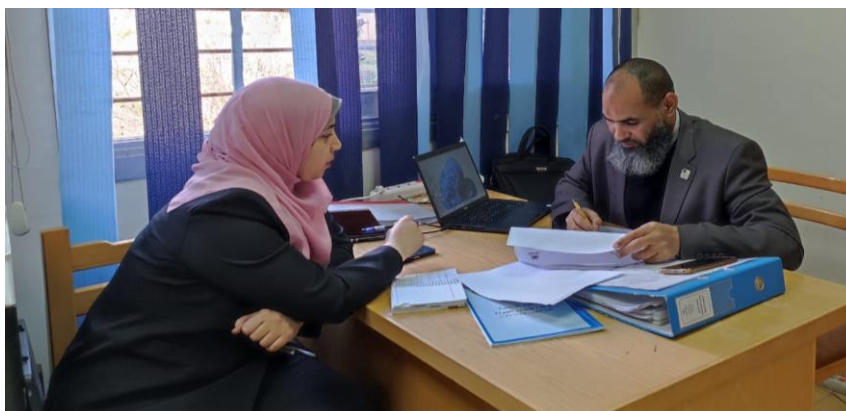
مراجعة المعيار الأول (رسالة وأهداف البرنامج)