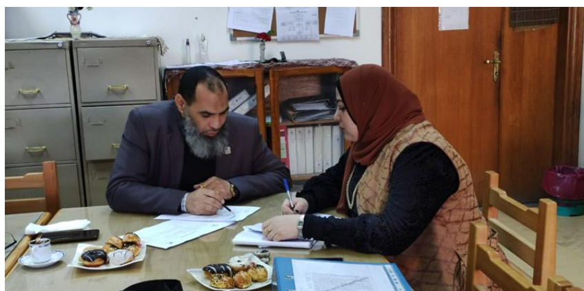
مراجعة المعيار السادس (الموارد ومصادر التعلم).