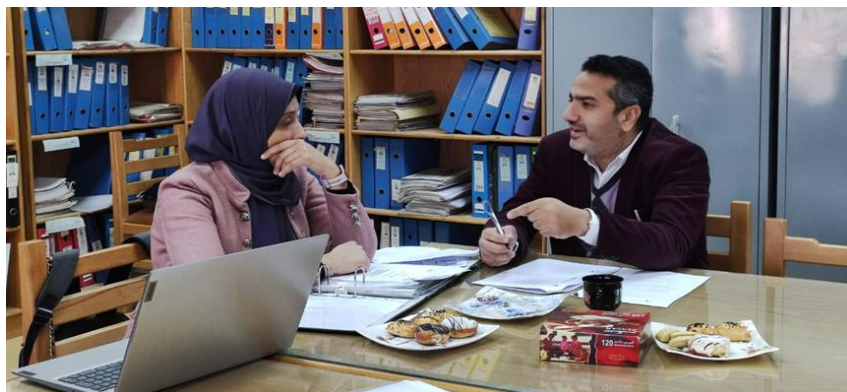
مراجعة المعيار الرابع (الطلاب والخريجون)