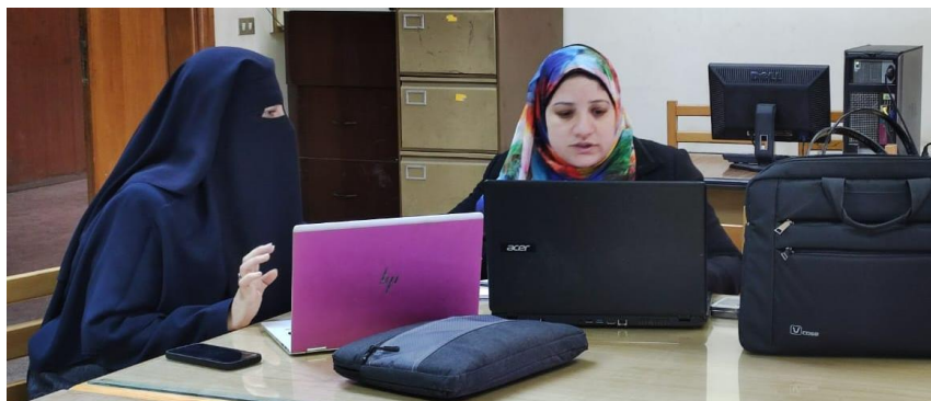
اجتماعات لجنة الدعم الفني مع فرق جودة برامج قسم الكيمياء